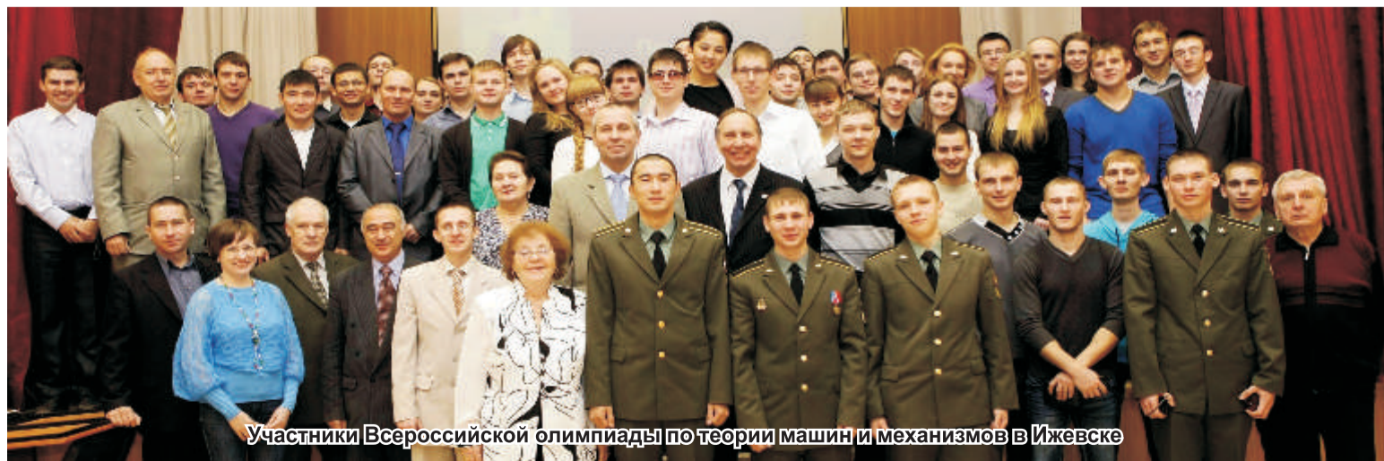
Участники Всероссийской олимпиады по теории машин и механизмов в Ижевске