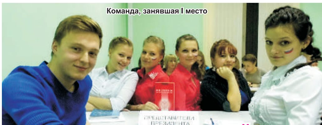
Команда, занявшая I место